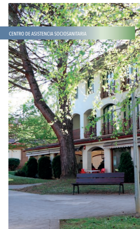
CENTRO DE ASISTENCIA SOCIO-SANITARIA

Recuperaremos el fondo del río en las zonas canalizadas para ayudar a la regeneración de la fauna autóctona. También crearemos un fondo municipal que tendrá como principal objetivo la regeneración de nuestros bosques a través de la plantación de especies autóctonas y la adquisición de nuevas parcelas.