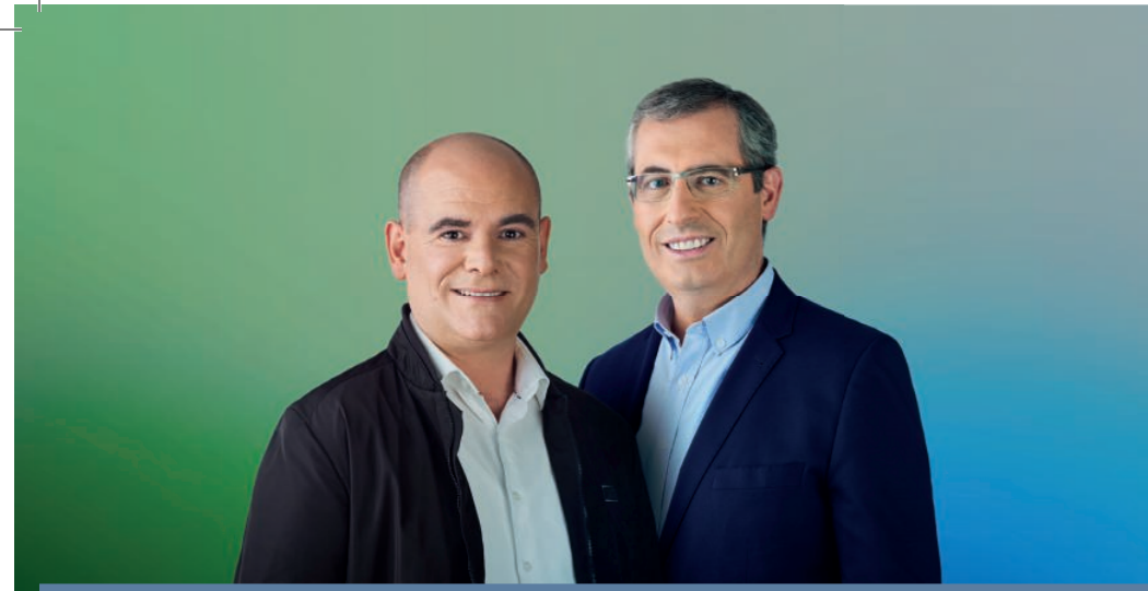
UNAI ELKORO OIANGUREN CANDIDATO A LA ALCALDÍA DE ARETXABAETA