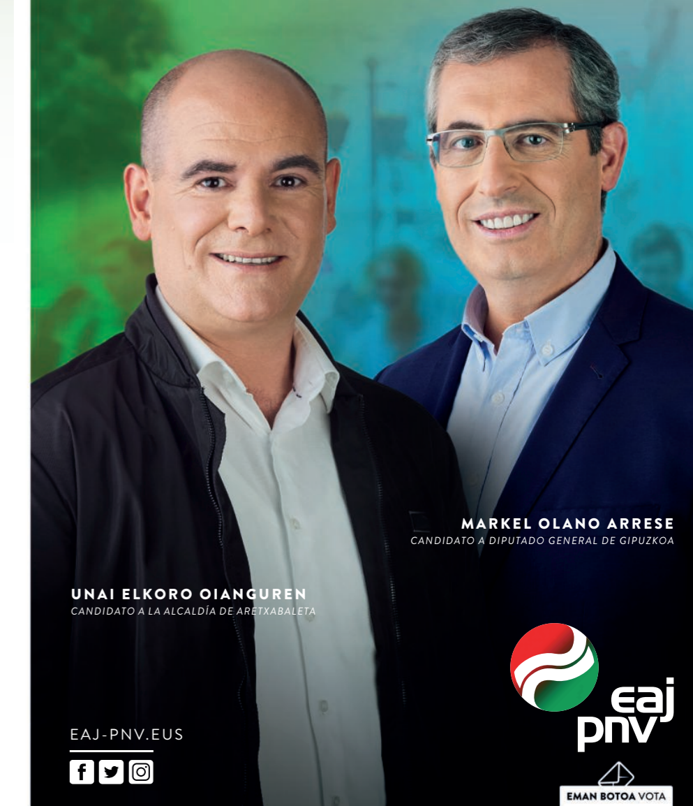
MARKEL OLANO ARRESE CANDIDATO A DIPUTADO GENERAL DE GIPIZKOA